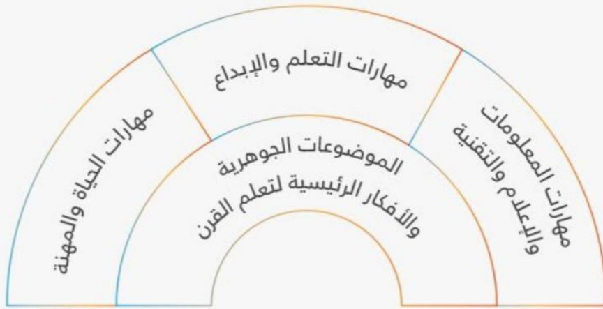
قوس قزح لمعارف ومهارات القرن الحادي والعشرين

ومهارات التكنولوجيا وثقافة المعلومات والاعلام وفروعها ( مهارة تطبيقات المعلومات والاتصال، مهارة الثقافة المعلوماتية، مهارة ثقافة الاعلام)، مهارات الحياة والعمل والتي تشمل ( مهارة القيادة والمسؤولية، مهارة المبادرة والتوجيه، مهارة التكيف والمرونة، مهارة الإنتاجية والمسائلة، مهارة التفاعل الاجتماعي )